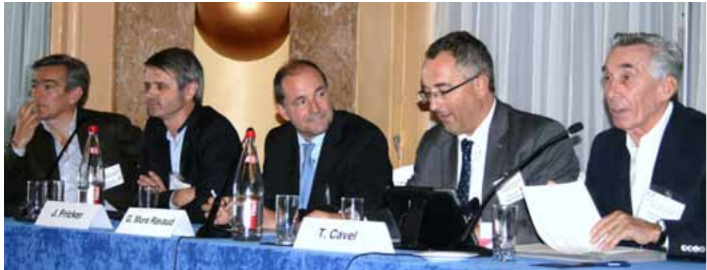
Etat et futur de l'impression numérique vus par les imprimeurs et les éditeurs

Le marché mondial des liseuses, après avoir franchi un pic de près de 25 millions d'unités vendues, est passé à 15 millions d'unités vendues en 2012 et, on s'attend à ce qu'il soit juste supérieur à 10 millions en 2013. Toutefois